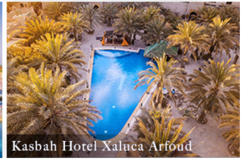
Kasbah Hotel Xaluca Arfoud