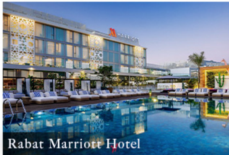
Rabat Marriott Hotel