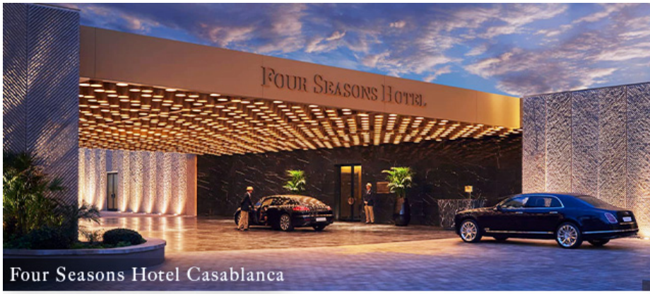
Four Seasons Hotel Casablanca