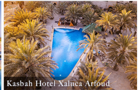
Kasbah Hotel Xaluca Arfoud