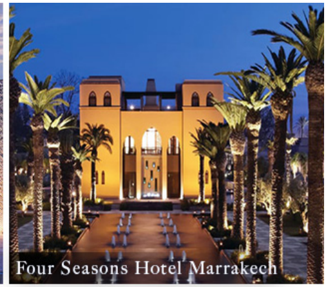
Four Seasons Hotel Marrakech